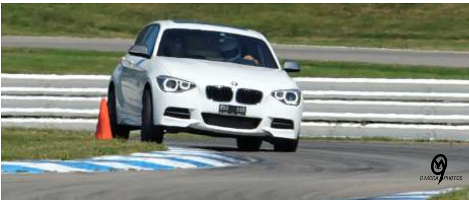
Paul-Etienne Rousselot - BMW M135ix

Cette fabuleuse journée se déroula pour le mieux, et se poursuivit pour de nombreux Meutards, chez Ouilian. Un très grand merci à lui ! Terminer une journée circuit par une baignade en piscine (même fraîche) est toujours agréable. Vivement la prochaine saison de sorties circuit.